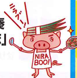
にら豚 PRキャラクター 「にらブー」