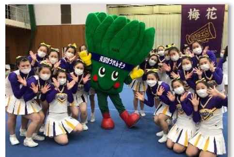
梅花女子大学チアリーディング部レイダース