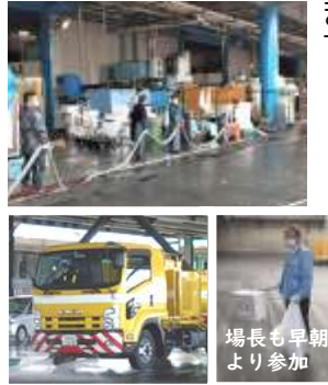
場長も早朝より参加

3月10日の朝、水産が8時半、青果は12時より大掃除が実施されました。なお、いつも配給させていたお茶が諸般の事情により間にあわず大変失礼いたしました。お詫びいたします。6月には必ず配給させていただきます。