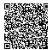
食品衛生申請等システム