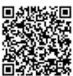
府HP「食品等の自主回収(リコール)報告制度について」

また、リコールを行う場合、消費者に正しい情報を公表する必要があります。万が一の事態に備え、届出方法等を確認しておきましょう!