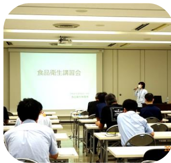
受講中。講師は衛検、阪上副主査

■食品衛生指導票 提出のお願い 今年も、標記指導票を12月初旬頃に回収させていただきます。食品衛生指導員の皆様には、ご協力をお願いいたします。 なお、場内では、現在、25名の皆様に食品衛生指導員に就任いただいております。本業、ご多忙の中、巡回指導など市場に欠かせられない業務に従事いただいております。