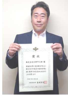
フィールドフルーツ(株)様