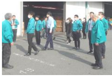
北果避難訓練の様子

11/21(金)、大阪北部で地震が発生した想定で、避難訓練と被害状況・負傷者数の模擬報告を内容とする防災訓練が行われ、訓練により抽出された課題解消に取り組んでいくこととされました。