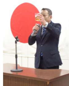
川邊常駐代表者会議議長