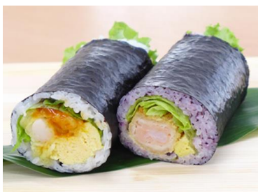
梅花女子大学食文化学科1年生考案 海老チリ&海老タル恵方巻

当日は、大丸梅田店、大丸須 磨店、無印良品 京都山科店で 学生が店頭立ち、商品の魅力